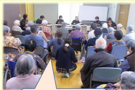
ボランティア訪問 大正琴の会

グループホーム喜楽では、毎月恒例になっている「喜楽の会」を行いました。一か月に一度、喜楽Ⅱと合同で開催し、歌やレクリエーションで交流します。お食事は、みんなの大好きなお寿司です。いつも、ノンアルコール飲料で宴会気分！