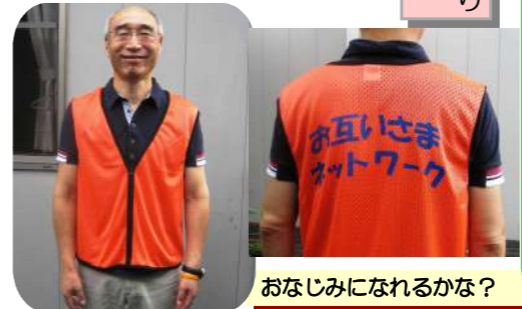
おなじみになれるかな?

お互いさまネットワークの活動が地域の皆さまの目にとどく機会を増やしご理解いただくために、今年度からオレンジ色の上着を着用しています。北成島町の行事に参加する時や、食料品の買い出し等で使います。支援の着用品は、その場に合った柔軟な対応をいたします。