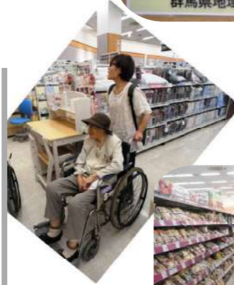
みんなで楽しく買い物

5月14日(土) 家族会・・・太田イオンへ出かけ、家族と一緒に食事や買い物をして、楽しい一日でした。 6月23日(木) みんなで外食へ行ってきました。魚べいでお寿司をお腹いっぱい食べて大満足でした。 ～日常～ 畑では、なすきゅうりトマトピーマンなど夏野菜が収穫期です。なすときゅうりはぬか床へ漬けみんなで「うまいね～」と美味しく頂いています。 ぬかみそに愛情をこめ、手で毎日かき混ぜて・・・