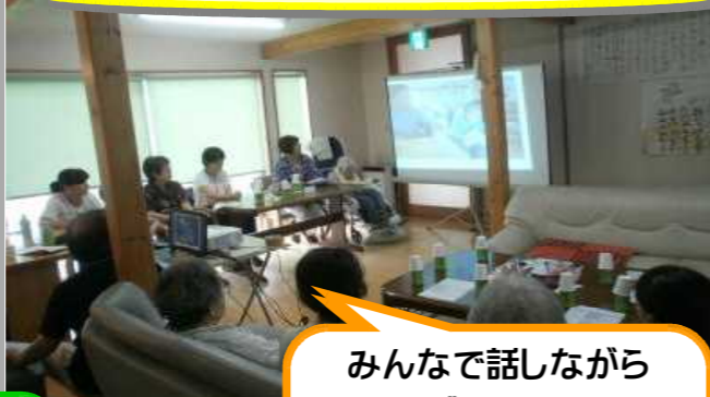
みんなで話しながら スライドを見ています

運動会に参加したり、一泊旅行に行ったり、着物を着たり、ブラックコーヒーを飲んだり花見に行ったり、ウナギを食べたり・・・ご家族のみなさまのご協力に、感謝申し上げます。