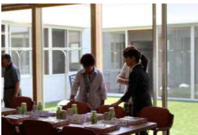
明るい中庭を 取り囲んで居室が 九室あります。