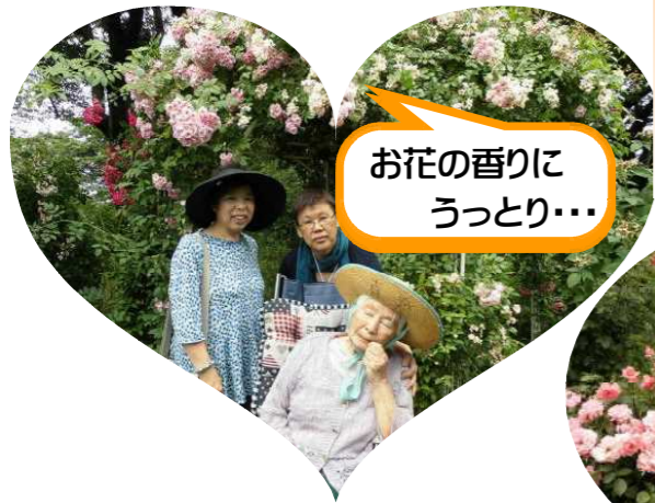
お花の香りに うっとり...

6月6日(土) 喜楽の家族会が行われました。今回は、ザ・トレジャーガーデン館林(野島の森)です。天候にも恵まれ、ご家族と一緒にゆっくりと散策を楽しむことが出来ました。施設内のバラに囲まれた部屋で食事を共にし、みんなで楽しいひとときが過ごせました。ご家族の協力により素敵な笑顔がたくさん見られ、素晴らしい家族会でした。