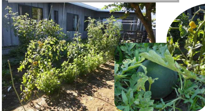
喜楽の裏に 畑あり!