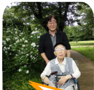
足元の雑草だって 美しく 可愛いのも