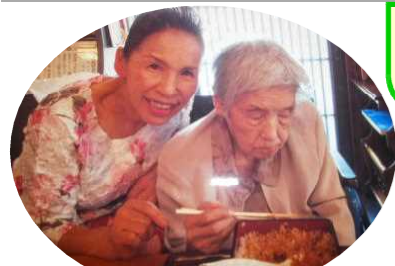
うな重 堪能! ⇒ブラックコーヒー 片手に