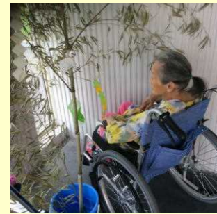
仲間が増えますように