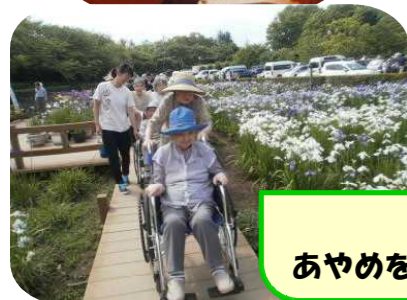
6月8日 あやめを見に行きました