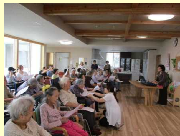
「ボランティア訪問」が行われました。多機能ケアの喜楽のホールを使って初めての催しです。

「多機能ケアの喜楽」多機能ケアとは、通い、訪問泊まりの機能を使い、二十四時間、三百六十五日の柔軟なケアで、できる限り長く自宅生活で生活できるよう支える介護サービスです。その方にとってふさわしい利用の仕方を、こいっしょに考えながらケアプランを作成します。随時見学も可能です。まずは、お気軽にご相談ください。スタッフ一同心よりお待ちしております。