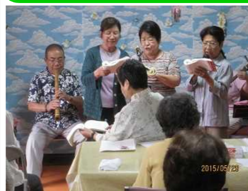
民謡の先生方のご指導の下、懐かしいふるさとの歌を歌っています。