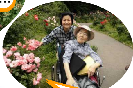
ずっと続くバラの小道 園内は結構広いわねえ