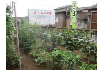
出番を待ってる野菜たち