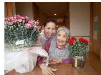
母の日「いつも ありがとう」