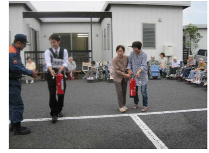
消火器操作の訓練