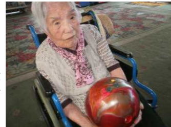
館林スポーツレイン