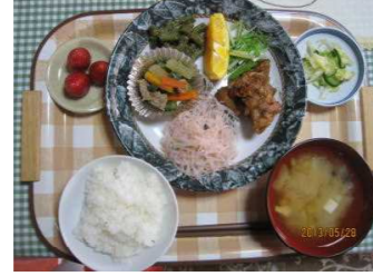
ランチ・おいそ～でしょ！