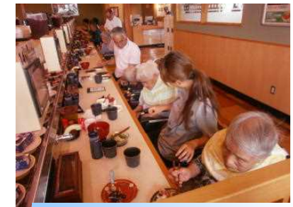
「たまには外で食べるのも いいわねえ～」 外食 はま寿司 です