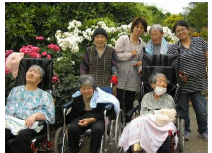
平成二十五年六月二日 足利フラワーパークにて