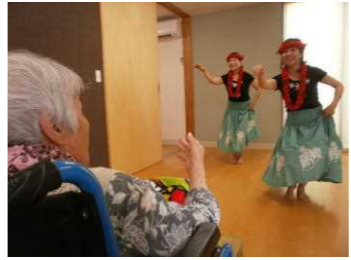
皆さんの笑顔！ 美しかったです。