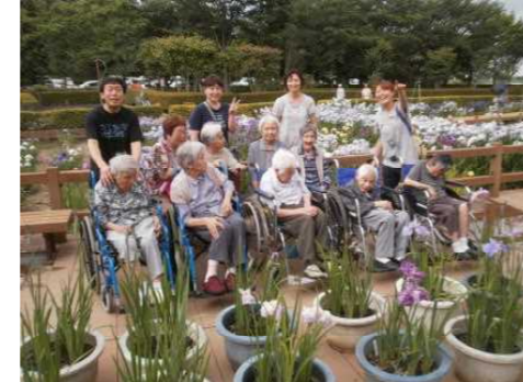
花菖蒲～みんなで記念撮影