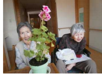
私 が き れ い な 花 を 育 て ま し た！