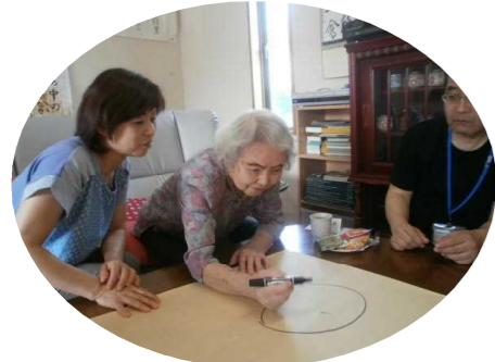
祝 誕生会！ 84歳のお誕生日を 迎えられました。